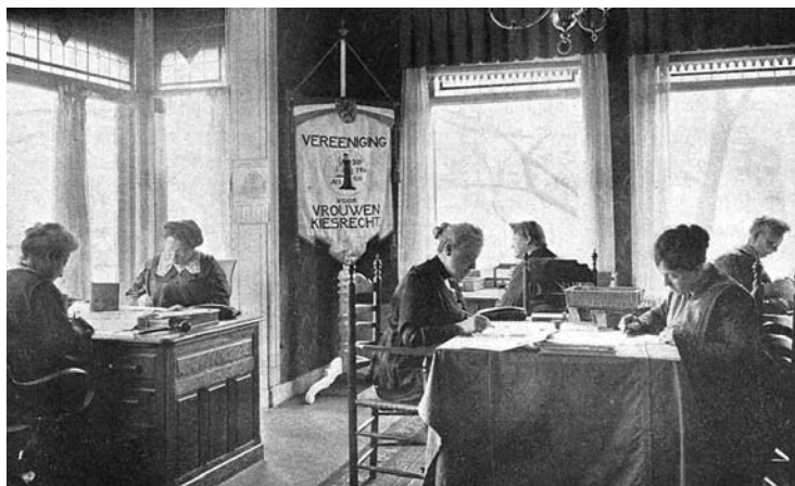
Gedenkboek Vereniging voor Vrouwenkiesrecht 1894-1919

Vrouwen werden hier aangesproken op hun plichten als Nederlandse burgers. Het Comité stelde dat vrouwen door steun te bieden aan de door het dagelijks bestuur in te stellen provinciale en plaatselijke comités, meehielpen de "volkskracht" en nog belangrijker, "onze zelfstandigheid als natie [te] bewaren." Vrouwen >>