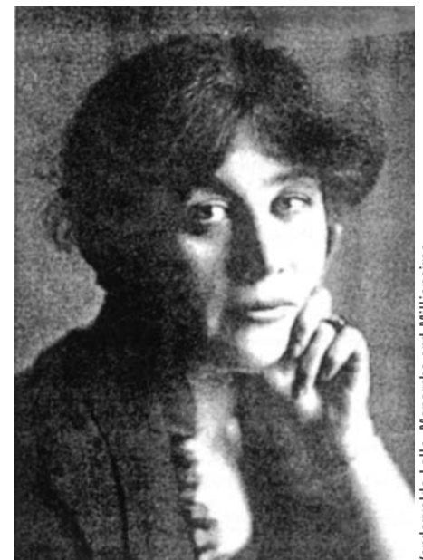
Vandervelde Lalla, Monarchs and Millionaires.