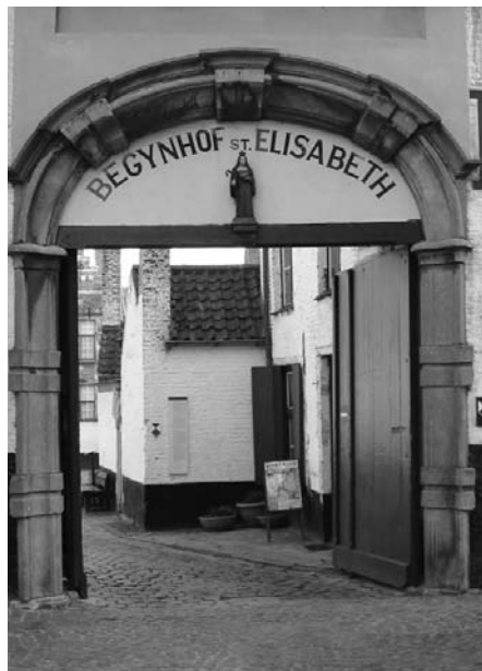
Ingang van het begijnhof te Kortrijk (provincie West-Vlaanderen).

Nog een andere aanduiding wijst op de reikwijdte van het intellectuele leven van begijnen: de beschermheiligen die begijnhoven kozen als naam voor hun instelling, en die begijnen in staat stelden om zich in de lijn van de Kerk in te schrijven, en tegelijk een deel van de identiteit van hun begijnhof te benadrukken. Terwijl Maria zonder verbazing het grootste succes kende, werd ze direct gevolgd door Sint-Kathelijne van Alexandria, de maagdelijke onderwijzeres, en Maria-Magdalena wiens evangelisch en intellectueel werk begijnen enorm inspireerde. Zo schetst zich, op basis van een eenvoudige lijst van de meest populaire beschermheiligen, de identiteit van talrijke begijnhoven. Interessant is op te merken dat twee op vijf instellingen ervoor kozen zich te identificeren met