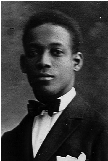
De activist Anton de Kom, schrijver van het klassieke boek Wij slaven van Suriname .