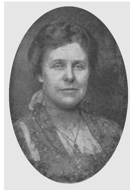
Gedenkbuch Nederlandse Bond voor Vrouwenkiesrecht 1907-1917