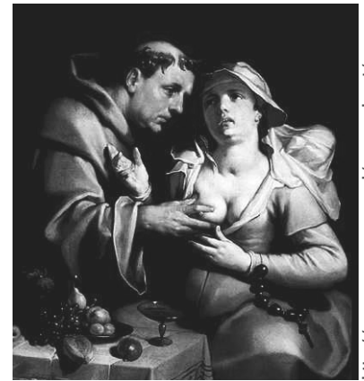
De monnik en de begijn, geschilderd door Cornelis Cornelisz van Haarlem (1562-1638).

De bijdragen van de grote mystica's van de 13 de eeuw, in het bijzonder van Hadewijch, spreken boekdelen over het intellectuele leven van begijnen. Hadewijch, een toonaangevende mystica en groot-meesteres (de overste) van een – niet nader geïdentificeerde – begijnengemeenschap, werd bekend met haar Visioenen , waarin ze haar verschillende mystieke ervaringen met Jezus in sterk erotiserende termen beschreef. Ze was een geleerde vrouw die zich moeiteloos in het Latijn kon uitdrukken. Toch besliste ze haar Visioenen in het Diets, haar moedertaal, te schrijven, met het doel om zo gelezen en becommentarieerd te kunnen worden door haar zusterbegijnen tijdens hun dagelijkse gemeenschappelijke handarbeidsessies, een activiteit tijdens dewelke religieuze teksten werden gelezen en besproken. Deze mondelinge gedachtenwisselingen waren niet alleen cruciaal omdat ze voor een dynamische discussie zorgden maar ook omdat de meeste begijnen uit arme families stamden en dus analfabeet waren. De debatten werden meestal geleid door degenen die wel konden lezen, vaak de grootmeesteressen. Uit de brieven van Hadewijch blijkt dat in haar eigen gemeenschap haar geschriften talrijke theologische conflicten veroorzaakten, omtrent bijvoorbeeld het evenwicht tussen passiviteit en de actieve uitdrukking van liefde, of het feit dat haar spirituele