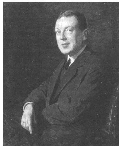
Bron: Ismee Tames, Oorlog voor onze gedachten.

Het onderzoek naar het vocabulaire van woordvoersters van de feministische vrouwenbeweging in Nederland tijdens de Eerste Wereldoorlog opent deuren voor verder onderzoek naar interpretaties van vrouwelijk burgerschap. In het licht van de uitkomsten van dit onderzoek is het interessant het blikveld te verbreden naar andere groepen vrouwen, bijvoorbeeld de vele confessionele vrouwenverenigingen die Nederland in de periode rond de Eerste Wereldoorlog kende. Veel van deze vrouwen stonden weliswaar ver van de feministen en hun strijd voor volwaardig staatsburgerschap, maar hadden wel degelijk ideeën over hun verantwoordelijkheden in de samenleving. Om deze